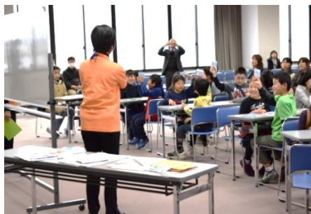
奈良農協で実施した小学生向けカード講座「知って使おう！カードいろいろ」講座風景

もう 1 つは 2018 年 2 月 10 日、2 月 24 日に奈良農協で実施した小学生向けカード講座「知って使おう！カードいろいろ」です。親のクレジットカードを使ってゲームをすることや、サーバー型電子マネーの注意点などを盛り込んだ講座です。消費生活センター主催の親子講座や小学校の授業、学童保育などでの実施を考えています。